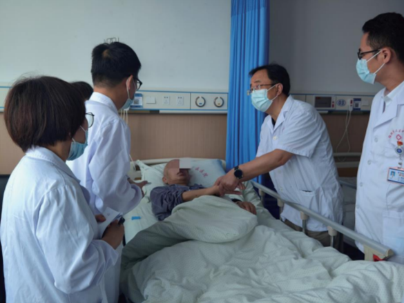
上虞区中医医院为肿瘤患者带来福音，依托北京中医药大学黄金昶教授团队力量。